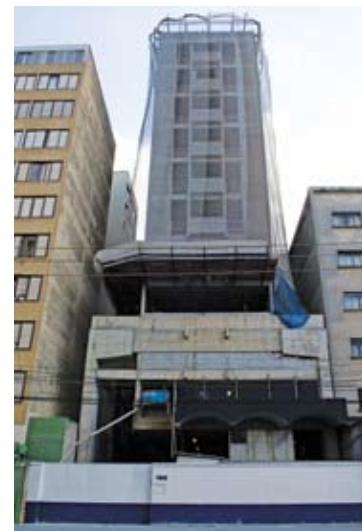
O Hospital do Coração em obras

Depois do fim da primeira fase de expansão e reforma do Shopping Pátio Paulista (veja na pág. 31), que trouxe novas lojas e restaurantes, além da total renovação do Piso 13