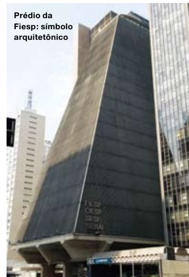
Prédio da Fiesp: símbolo arquitetônico

Toda a extensão da Avenida Paulista tem quatro estações do metrô que pertencem à Linha Verde. Por dia, passam por lá 385 mil passageiros. Em 2010, um novo terminal estará pronto, bem próximo ao da Consolação. Denominado Paulista, ligará as linhas Verde e Amarela (entre a Estação da Luz e a Vila Sônia). É nessa linha também que está prevista a inauguração, para 2012, do metrô da Oscar Freire.