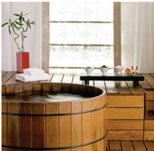
O spa do hotel Renaissance, na Alameda Santos

Neste centro turístico e econômico de São Paulo estão concentrados cerca de 20 grandes hotéis. Em sua maioria, de luxo. Da entrada até os quartos, todos os serviços são realizados seguindo os padrões de qualidade internacional. Os destaques são: Fasano (Rua Vittorio Fasano, 88, tel. 3896-4000, www.fasano.com.br ), Golden Tulip Paulista Plaza (Alameda Santos, 85, tel. 3177-0400, www.paulistaplaza.com.br ), Intercontinental São Paulo (Alameda Santos, 1123, tel. 3179-2600, www.ichotelsgroup.com ), Emiliano (Rua Oscar Freire, 384, tel. 3068-4399, www.emiliano.com.br ) e Renaissance São Paulo Hotel (Alameda Santos, 2233, tel. 3069-2233, www.marriott.com.br ).