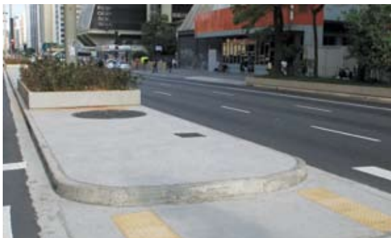
Os novos canteiros da Avenida Paulista

A região ganhará duas estações de metrô. Uma na esquina da Rua Oscar Freire com a Avenida Rebouças, a Estação Oscar Freire, e outra na Rua da Consolação, quase esquina com