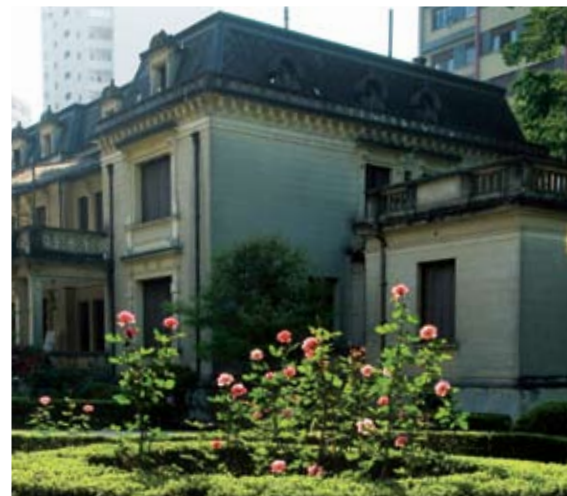
A linda Casa das Rosas, no número 37 da Avenida Paulista