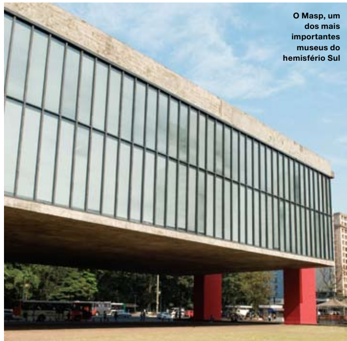
O Masp, um dos mais importantes museus do hemisfério Sul

Shopping Frei Caneca, tel. 3472-2365) e Reserva Cultural (Avenida Paulista, 900, tel. 3287-3529).