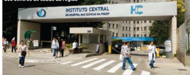
O Hospital das Clínicas, um dos 500 centros de saúde da região

com.br), Golden Tulip Paulista Plaza (Alameda Santos, 85, tel. 3177-0400, www.paulistaplaza.com.br ), Intercontinental São Paulo (Alameda Santos, 1123, tel. 3179-2600, www.ichotelsgroup.com ), Emiliano (Rua Oscar Freire, 384, tel. 3068-4399, www.emiliano.com.br ) e Renaissance São Paulo Hotel (Alameda Santos, 2233, tel. 3069-2233, www.marriott.com.br ).