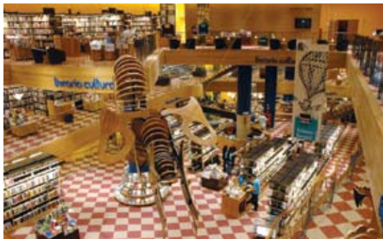
Livraria Cultura, dentro do Conjunto Nacional

Nacional, a Livraria Cultura ( veja na pág. 31 ) é um dos maiores exemplos: o espaço mistura teatro, cafeteria, livros e DVDs. Já a Fnac ( veja na pág. 30 ), tem duas entradas, pela Avenida Paulista, 901, e pela Alameda Santos, 960. Dos cinemas, que transmitem desde filmes alternativos até os mais comerciais, fique atento às programações destes locais: Cine Bombril (Rua Padre João Manuel, 100, tel. 3285-3696), Cine Bristol (Avenida Paulista, 2064, tel. 3289-0509), Cine Sesc (Rua Augusta, 2075, tel. 3087-0500), Espaço Unibanco (Rua Augusta, 1475, tel. 3288-6780), HSBC Belas Artes (Rua da Consolação, 2423, tel. 3258-4092), Unibanco Arteplex (Rua Frei Caneca, 569, 3º piso,