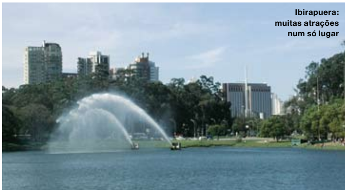
Ibirapuera: muitas atrações num só lugar

A região da Paulista é cercada por muito verde, restaurantes maravilhosos e espaços culturais