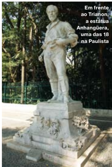
Em frente ao Trianon, a estátua Anhangüera, uma das 18 na Paulista